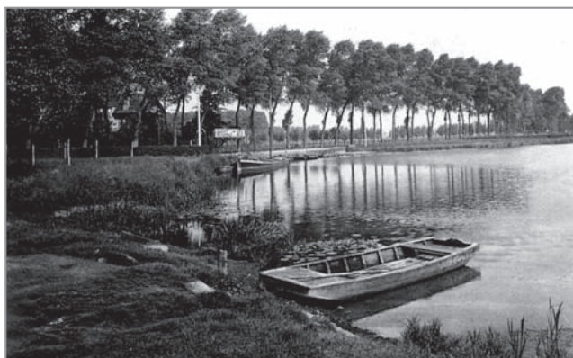
Pont, aangemeerd aan de boomgaard van het gemeentehuis

Dit boek kwam er in de eerste plaats door de gedrevenheid van een groep geboren Latemnaren, verenigd in 'Den Laethemsen Vriendenkring', die voor doel hebben de kroniek te schrijven van het volksleven tussen 1880 en 1980.