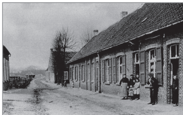
Het dorp van Sint-Martens-Latem omstreeks 1920