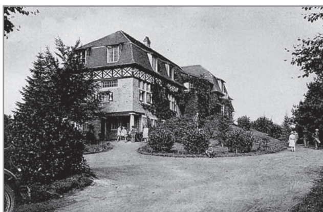
Clubhouse en restaurant van golfclub 'Les Buttes Blanches', thans Royal Latem Golfclub, 1933