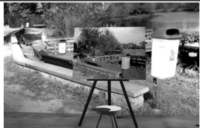
Leiesteiger opnieuw gegeerd door schildersvolkje

Ik zal steeds een volksjongen blijven en de dag dat dit soort schuinschrijverij niet meer getole-reerd wordt, mag de wereld vergaan. Ik zeg het een laatste maal: het is de bedoeling commen-taar en polemieken uit te lokken. Om die te publiceren in dit pamflet ontbreekt de plaats, maar de criticasters krijgen een wereldwijd forum op het internet, waar hun commentaar te grabbel komt op de weblog van dit blad. Recht van spreken, recht van antwoord! Zo moet het.