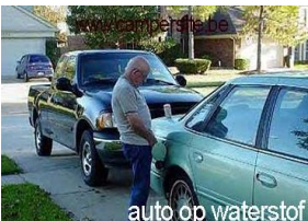
auto op waterstof

Sins damme weere moeten andses schudden en de madamkes (mee veel plezier) totten veur ons beste wensen - gemiend of nie - over te makken un ek nog nuut zuveel mensen nie geweten mee un vallinge! Allee, de mens zegt tons "un goeje gezondheid" en 't joar begint al mee snotteren of un indizeste van teveel toostses binnen te droaien. "Tro es teveele" zegdegge VDB in den tijd, moar ik durve d'er veuren uitkommen da'k ne 'totter' ben! Mensen, 'k wense ulder ollemolle 't allerbeste en nen gruiten libido want 't schijnt da veel seks vrie gezond es. Zegget moar ollemol ziere vuurts! Un beetse liefde, un beetse vreugde... (of was't nui vrede) stond toch in da liedse van Nicole of oe noemdegge da jong pupke nui weere? Doet da goe ee van de joare!