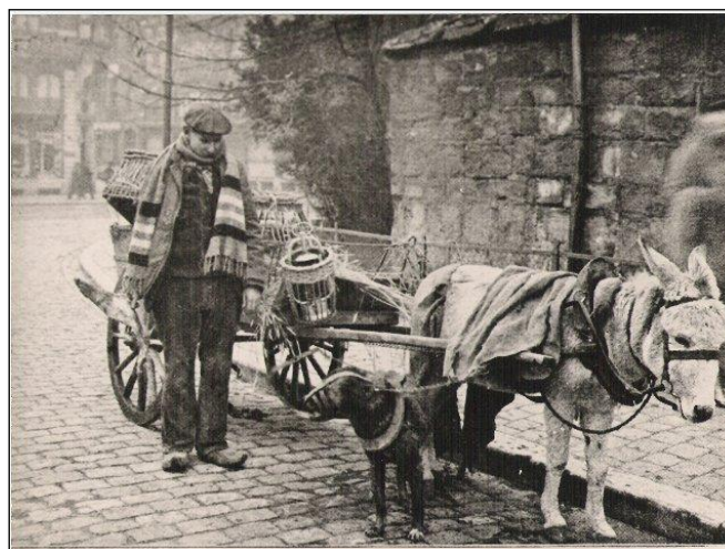
Rondtrekkende poeldenier aan de St. Nikolaaskerk