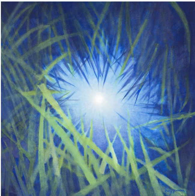
Fons Roggeman - "Zonlicht"

Tel/Fax : 09/329 67 39 - GSM : 0475/94 98 18 - E-mail : campevents@telenet.be - Bank : 390-0344860-80